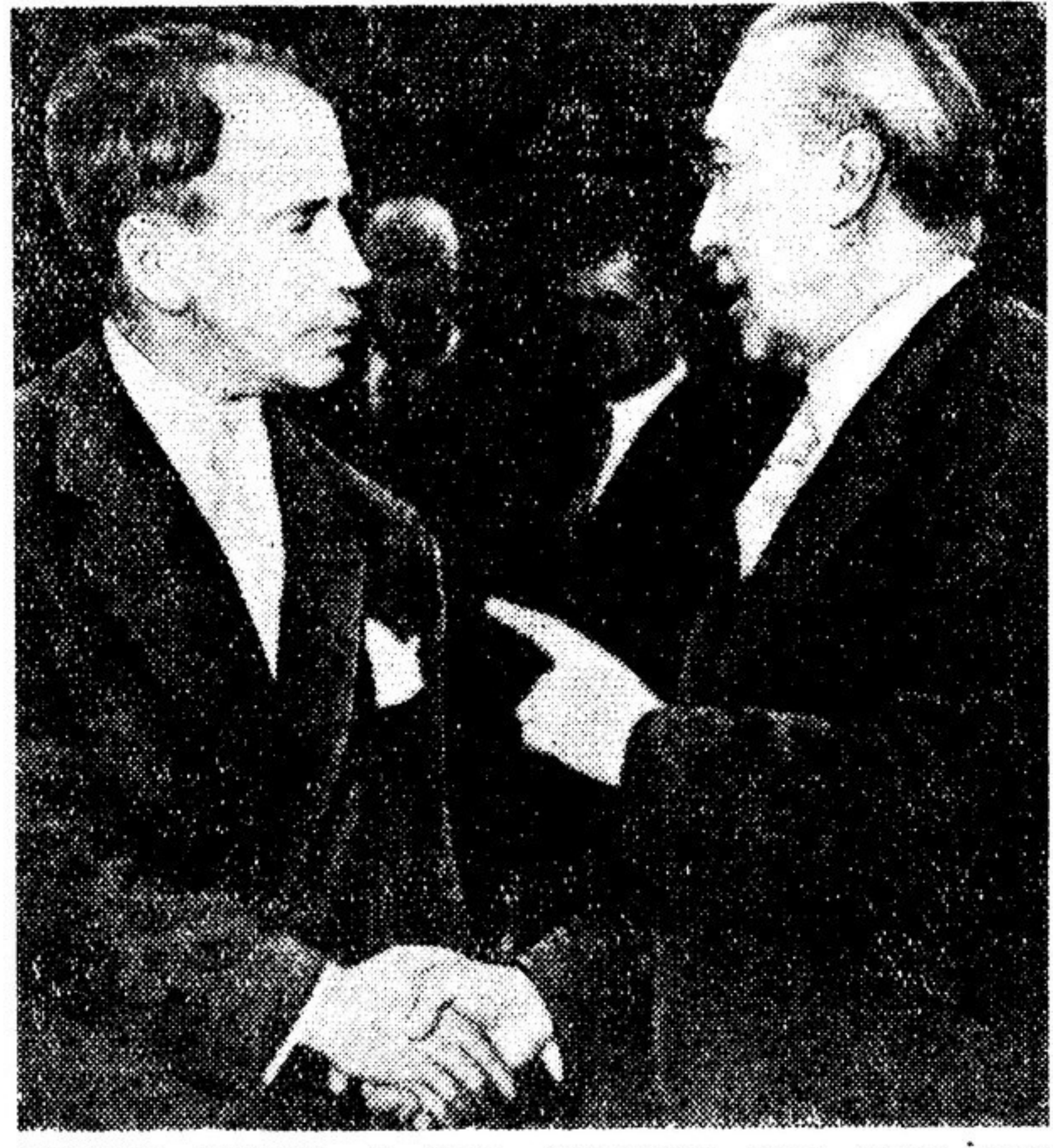
Аденауэр (справа) и Пина пожимают друг другу руки после беседы. Снимок из французской газеты «Юманите»