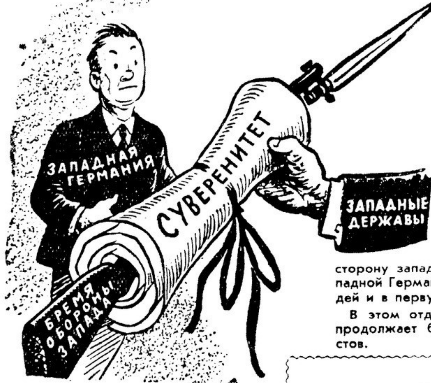
Рисунок худ. Джастина из американской газеты «Миннеаполис стар»

Председатель западногерманских реваншистов не поучает французского министра, но решительно предупреждает его. На лице Пина написано величайшее внимание со значительной дозой почтительности.